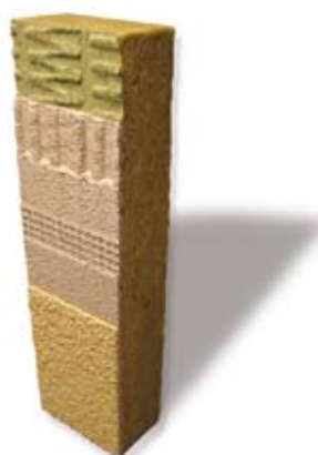
H DOMUS ROCK