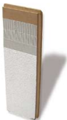
H DOMUS WOOD